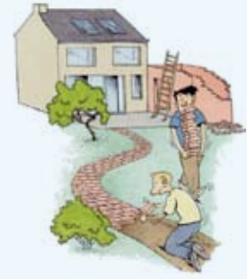
Illustratie door Jacques Debroux i.o.v. de provincie Vlaams-Brabant

Afbraakmateriaal dat je niet zelf kan gebruiken, kan je naar het containerpark brengen. Het is belangrijk om deze materialen al tijdens het afbreken te sorteren. Gespecialiseerde firma's die het afhalen op het containerpark weigeren immers vervuilde fracties. Op de website van EcoWerk lees je hoe de ophalers het afval verwerken. Surf daarom naar www.ecowerf.be en klik op 'wat is afval?'