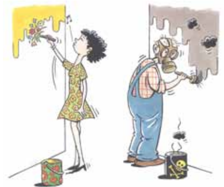
tekening van Jacques Debroux in opdracht van Provincie Vlaams-Brabant

Lijnolie, als al bindmiddel het hoofdbestanddeel vormt, wordt gewonnen uit vlas. Als verdunningsmiddel gebruikt men citrusolie en gomterpentijn, afkomstig uit pijnboomhars (niet te verwarren met terpentijn, een synoniem voor white spirit). De gebruikte kleurstoffen zijn uit aarde gewonnen anorganische pigmenten of van dierlijke of plantaardige oorsprong. Deze natuurlijke kleuren zijn zeer rijk en niet artificieel.