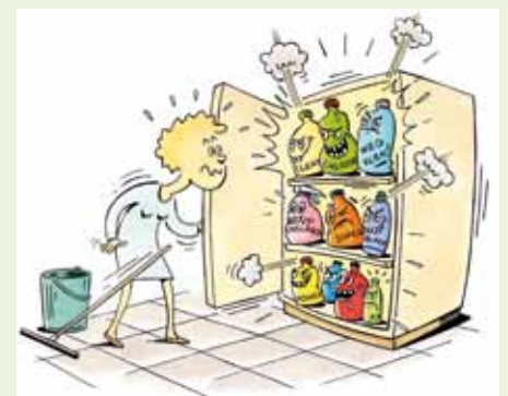
tekening van Jacques Debroux in opdracht van Provincie Vlaams-Brabant

Kleine restjes schoonmaakmiddelen worden niet voor niets gratis ingezameld bij het Klein Gevaarlijk Afval. Nadat ze gedeponereerd werden op de afdeling KGA op het containerpark, haalt een gespecialiseerde firma ze op. Deze zorgt ervoor dat de schoonmaakmiddelen op een zeer hoge temperatuur – continu hoger dan 1000°C – verbrand worden. De gassen die daarbij vrijkomen worden gewassen en de hitte die ontstaat wordt omgezet in energie.