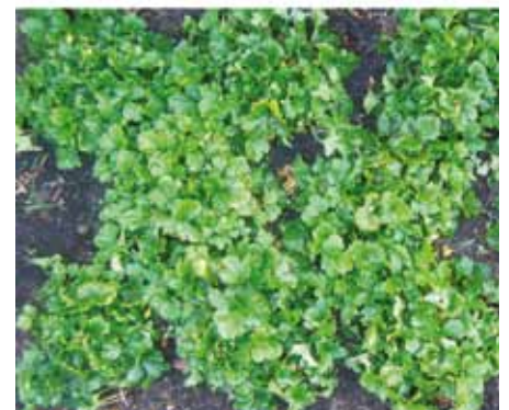
Perceel met bodembedekker Goudaardbei op 3 juli