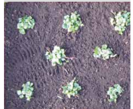
Perceel bij aanplanting met de bodembedekker Goudaardbei op 13 maart

Problemen met thuiscomposteren? Contacteer de milieudienst tel. 016/525422 of milieudienst@tremelo.be . Een compostmeester komt dan bij u langs.