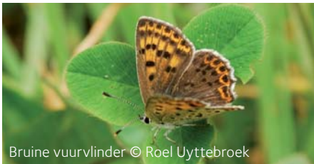
Bruine vuurvlieder

Het Regionaal Landschap Noord-Hageland ligt op de overgangszone tussen de leemstreek in het zuiden en de Kempen in het noorden. Tremelo sluit landschappelijk nog aan bij het werkingsgebied van het regionaal landschap. De ijzerzandsteenheuvels lopen bv. nog door tot in Tremelo (Balenberg). Het Laakdal is een vroegere Demer-arm en sluit aan bij de kenmerkende Demervallei in Noord-Hageland. Binnen de overgangszone die het regionaal landschap is, vormt Tremelo de grens tussen de Brabantse Kempen (Tremelo) en het Hageland (Baal).